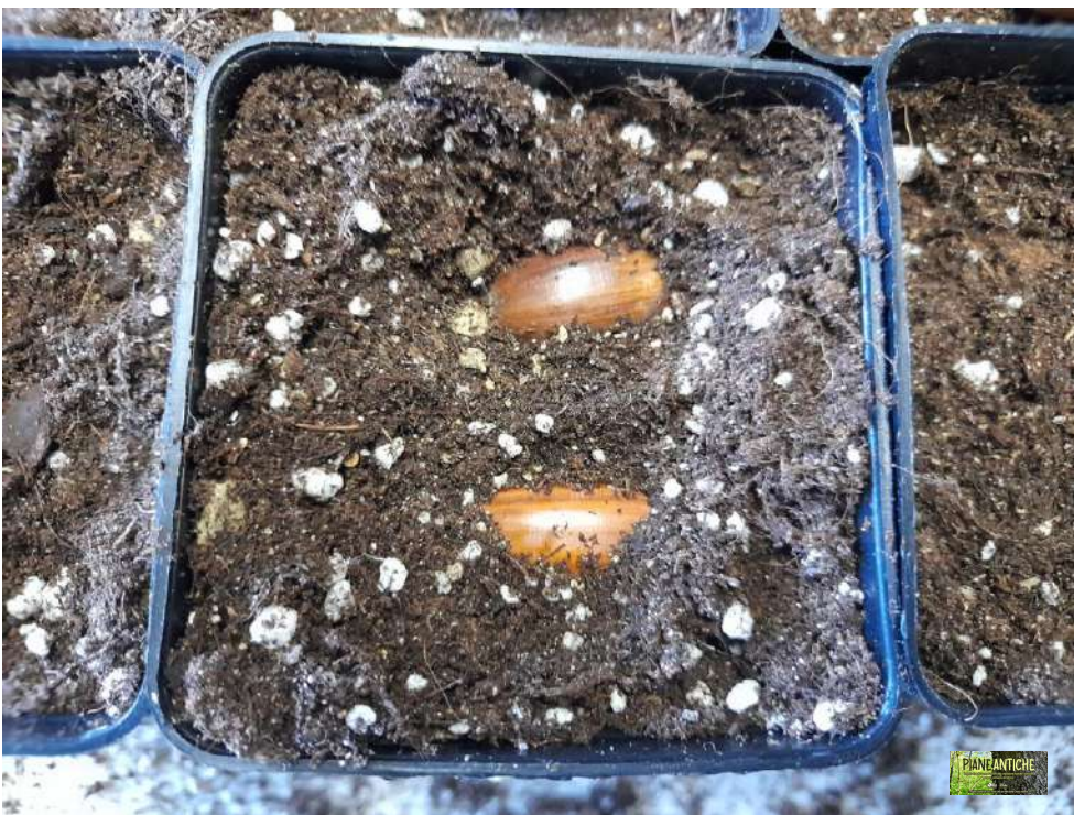
Foto 10 – Dettaglio delle due ghiande per vaso appena interrate, prima di essere coperte.