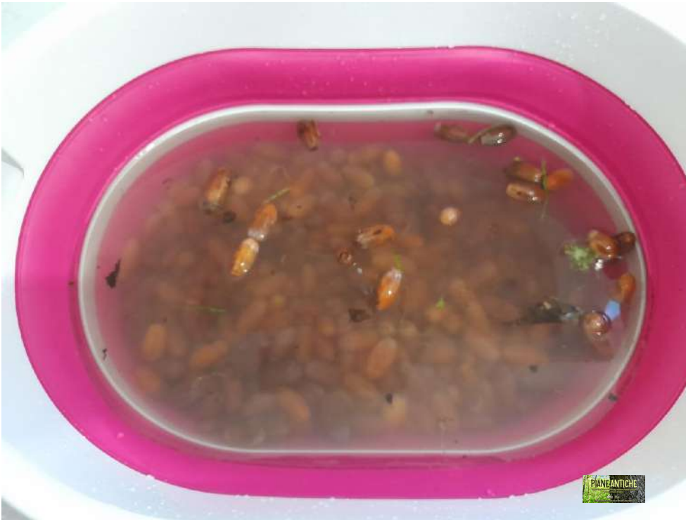
Foto 1 – Prova di galleggiabilità ed eliminazione delle ghiande secche.