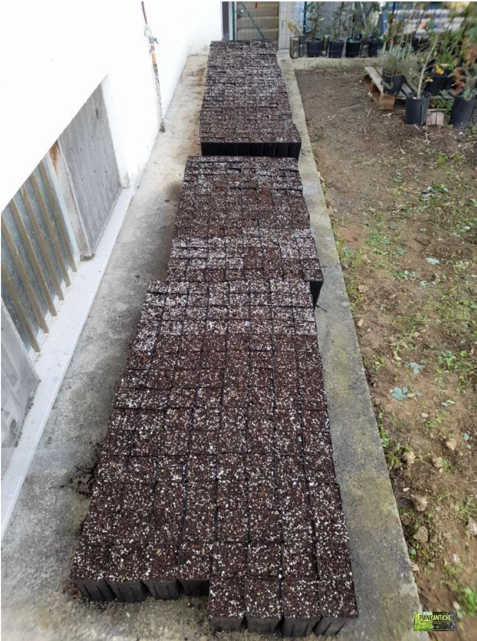
Foto 11 - Sistemazione provvisoria dei 500 vasetti. Annaffiatura e risistemazione delle ghiande affioranti.