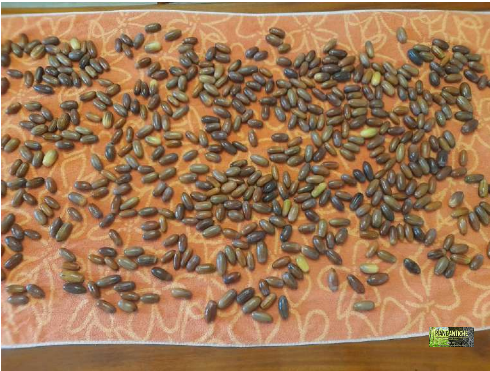
Foto 3 – Asciugatura ed allontanamento di ulteriori ghiande danneggiate.