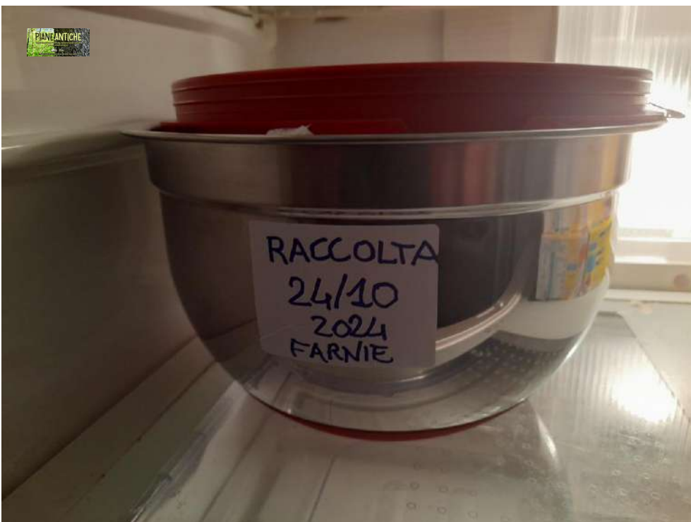
Foto 4 – Conservazione delle ghiande a bassa temperatura, in attesa della loro semina.