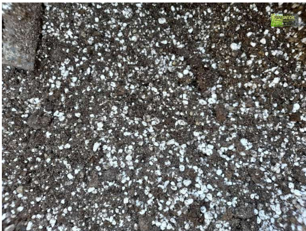
Foto 7 – Dettaglio della miscela di terriccio appena preparata, ancora in betoniera.