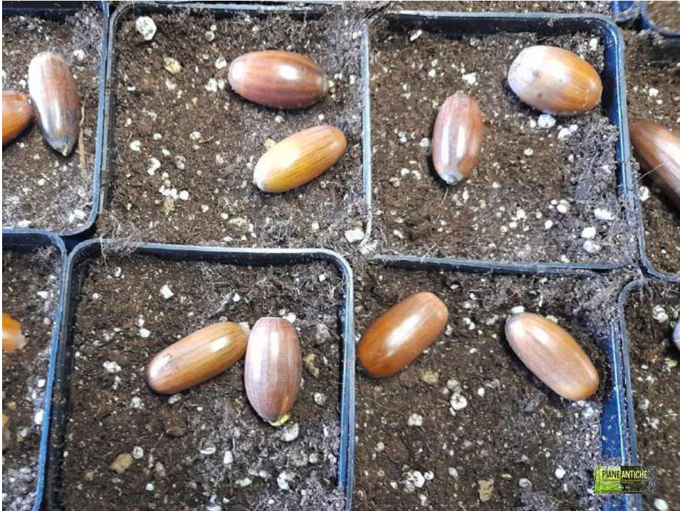
Foto 9 – Dettaglio delle due ghiande per vaso in attesa di essere interrare.