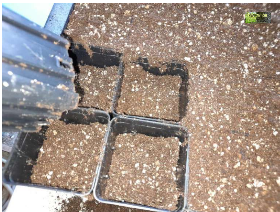
Foto 8 – Dettaglio della seconda compattazione della miscela di terriccio nei vasi.