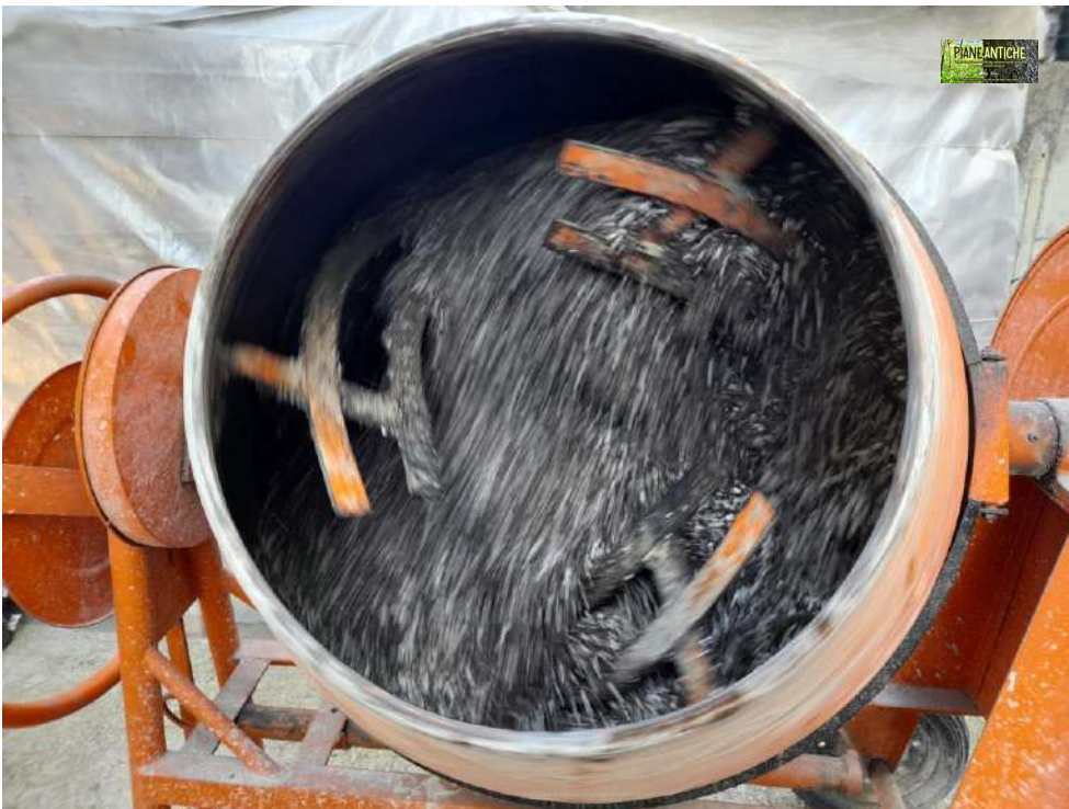
Foto 6 - Betoniera utilizzata per mischiare i sacchi di terriccio, il sabbione e l'agripelite, a formare la miscela di terriccio utilizzata per la semina delle ghiande di Farnia.